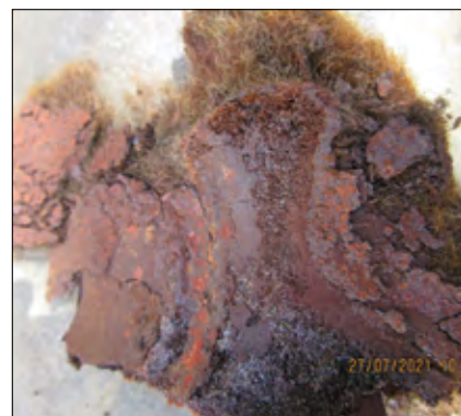
Fot. 4. Korozyja na wkładce filcowej

rzyszowana jest zaleta opisana w katalogu Logstor tymi słowami: „W systemie nadzoru z filcami w mufach szybciej następuje wykrycie zawilgocenia i wysłanie komunikatu o zaistnieniu usterki”. To jest oczywiście prawda. Zastanówmy się, jakie ma ona zastosowanie praktyczne. W której firmie podejmuje się działania naprawcze natychmiast po zasygnalizowaniu alarmu? Przecież świecące na czerwono detektory to niemalże standard, nie cieknie?, to się nie śpieszy. Dobrze, jeśli działania podej-