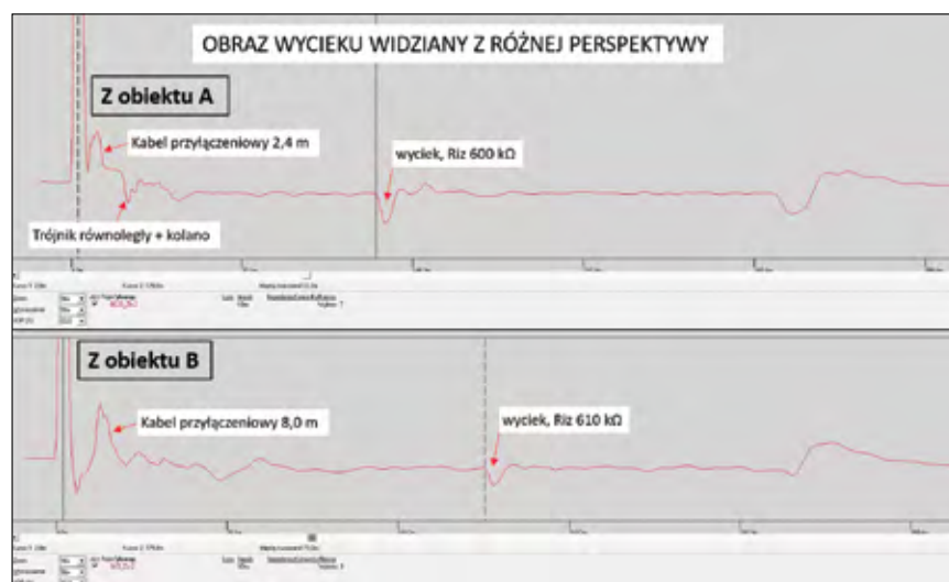
Rys. 1. Obraz wycieku widziany z różnej perspektywy

rys.1. Figurująca w opisach różnica w re-