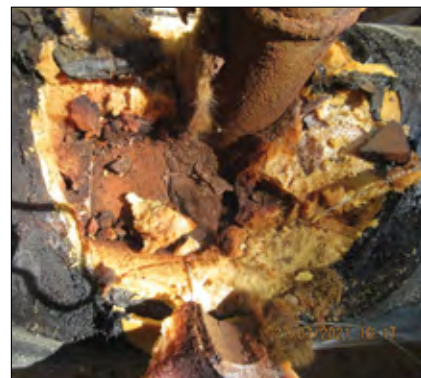
Fot. 3. Korozyja trójnika z podkładką filcową

muje się po miesiącach. Nawet w okresie gwarancji sprawy są odwołane w nieskończoność. W tym czasie wilgoć rozprzestrzenia się także poza wkładkę filcową i miejsce nacieku jest także dobrze widoczne na drucie bez podkładki. Na rys. 4 przedstawiono dwa wykresy zebra-