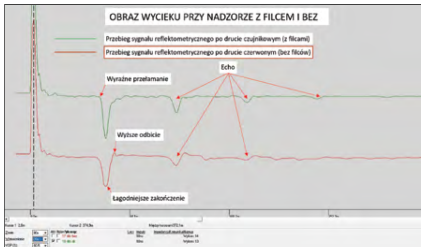
Rys. 4. Wykres z filcem i bez