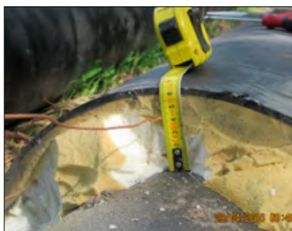
Fot.1 Położenie drutu alarmowego, norma mówi o 15 mm

Statystycznie w systemach impulsowych technika reflektometryczna (TDR) jest podstawową metodą lokalizacji uszko-