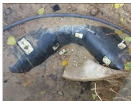
Fot. 2. Kolano z wyciekaniem wewnętrznym

zystancji izolacji jest rzeczą normalną, na wykresach widać bardzo wyraźnie miejsce wycieku. Po odkryciu rurociągu ( fot.2 ) okazało się, że kolano nadaje się do wymiany gwarancyjnej ze względu na bar-