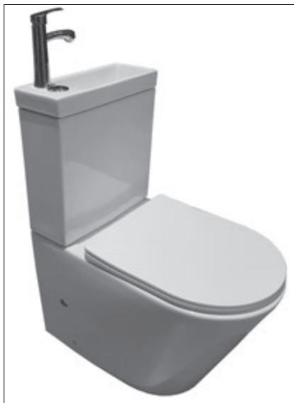
Rys. 3. Miska ustępowa zespolona z umywalką: WC kompakt Sergio Eko Sensea [22] Fig. 3. Compact toilet with integrated washbasin: Sergio Eko WC by Sensea [22]

Na dzień dzisiejszy koszty, jakie należy ponieść na montaż tego proekologicznego rozwiązania są dość wysokie i nawet w nowym budynku zwrot nakładów na inwestycję jest długotrwały [20]. Dla budynku jednorodzinnego czas ten wynosi powyżej 20-tu lat. Najczęściej inwestycje obejmujące instalacje dualne realizowane są obecnie przez firmy dysponujące dużym potencjałem finansowym, które eksploatują budynki o dużej powierzchni użytkowej, co pozwala skrócić czas zwrotu zainwestowanych środków [14]. Brakuje wsparcia państwa w promowaniu tych stosunkowo nowych technologii, tak jak ma to miejsce np. w przypadku instalacji z panelami fotowoltaicznymi. Zapewnienie pomocy finansowej w postaci dotacji na wykonanie instalacji dualnej, zapewne przyczyniłoby się do rozwoju branży oraz